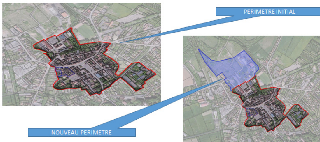
Intégration des parcelles référencées : Section 9 Parcelles 92/131/173/174/180/181/183/184/185