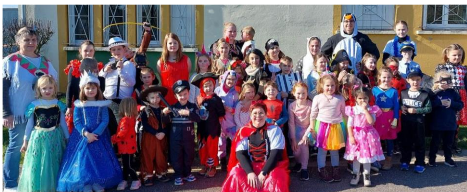
Centre aéré organisé par Le Foyer Rural – Février 2023