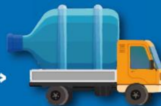
Table ronde à la Délivrance de Dieuze : « Gestion de la ressource en eau et distribution »

En présence d'élus et du CEDIF ( Coordination Eau Ile de France )