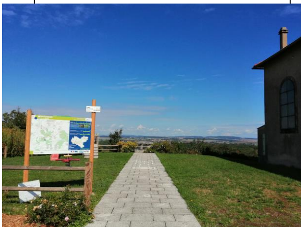
Panneau de départ à Montdidier

Pour faciliter également la pratique de la randonnée, des panneaux de départ ont été installés dans les communes traversées ainsi que des poteaux de carrefour. Ces poteaux indiquent aux randonneurs les directions à prendre pour poursuivre leur chemin.