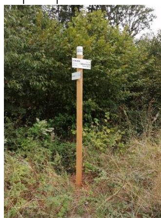
Un poteau de carrefour en forêt.