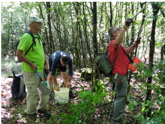
Séance d'élagage par les baliseurs avant la pose de la balise.