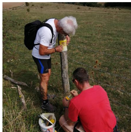
Balise peinte par les baliseurs bénévoles

Pour faciliter également la pratique de la randonnée, des panneaux de départ ont été installés dans les communes traversées ainsi que des poteaux de carrefour. Ces poteaux indiquent aux randonneurs les directions à prendre pour poursuivre leur chemin.