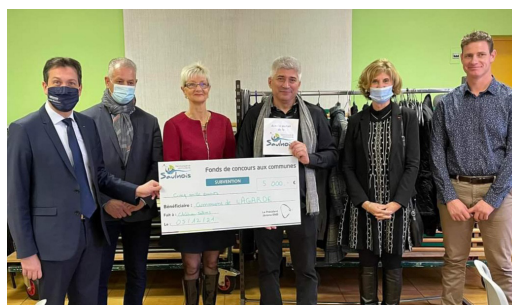
La commune de Lagarde a bénéficié de ce fonds de concours pour l'aménagement d'une nouvelle cuisine dans son Centre d'Animation Rural

Consécutivement et compte tenu des versements de ces fonds de concours en 2021, les Autorisations de Programme et Crédits de Paiement devront être mises à jour, afin que sur la mandature actuelle, chacune des communes du Saulnois puissent élargir à ce dispositif de soutien.