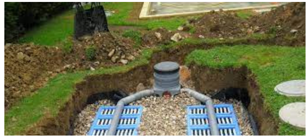
La loi Climat et Résilience prévoit l'augmentation du taux de majoration des pénalités jusqu'à 400%