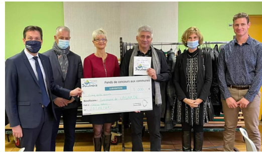
La commune de Lagarde a bénéficié de ce fonds de concours pour l'aménagement d'une nouvelle cuisine dans son Centre d'Animation Rural

Consécutivement et compte tenu des versements de ces fonds de concours en 2021, les Autorisations de Programme et Crédits de Paiement devront être mises à jour, afin que sur la mandature actuelle, chacune des communes du Saulnois puissent émarger à ce dispositif de soutien.