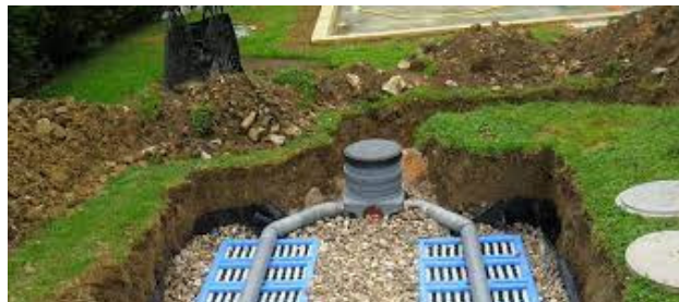
La loi Climat et Résilience prévoit l'augmentation du taux de majoration des pénalités jusqu'à 400%